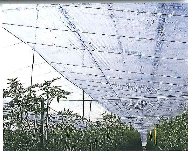
■みかど長寿水抜きの仕様

③ みかど長寿水抜きは、全光線透過率は90%に達し、作物の色づきも良く、光合成の活性化を促進させます。又、汚れにくく、耐久性にも優れております。